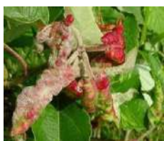
păduchele roz galicol